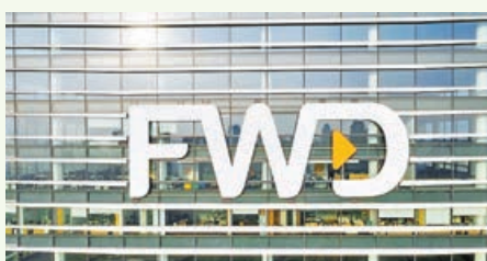
■富衛未落實上市時間表。

另外，消息人士指，本港電商友和集團(YOHO)亦已啟動在港首次公開發售的預路演工作，目標集資約1億美元(折合約7.8億港元)。