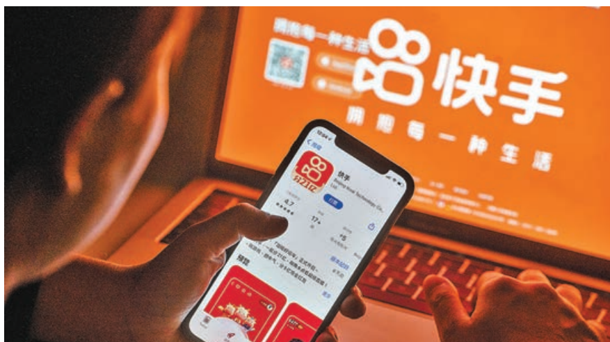
■快手否認董事長宿華被帶走配合調查。

北京市收緊防疫措施，消費股受壓，李寧(2331)挫9%，收市後公布業績的小鵬(9868)跌6.5%，理想汽車(2015)跌5%。