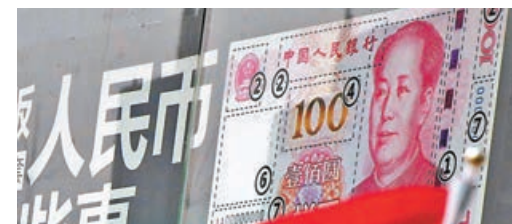
■人民幣資產對境外投資者具吸引力。

重啟不動戶：香港客戶如需重啟內地中國銀行不動戶，可致電內地中國銀行客服熱線。內地客戶如需重啟中銀香港不動戶，可聯絡中銀香港客戶聯繫中心或分行。