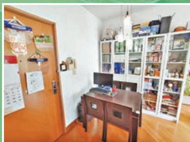
飯廳一角，配設大型玻璃櫃。