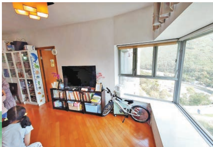
客廳遠眺一望無際山景。

南面高座住宅大樓的第1至6座為第一期藍天海岸，第二期以洋房部分為主則命名為水藍天。第三期則命名為影岸·紅，由兩座住宅大樓的第7座（A座）及第8座（B座）組成，北面中密度住宅大樓的第