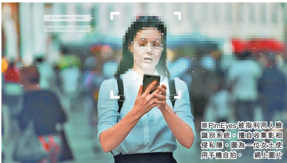
■ PimEyes 被指利用人臉識別系統，擅自收集影相侵犯私隱。圖為一位女士使用手機自拍。

便可嘗試確認其身份。還有匿名用戶稱，他會利用 PimEyes 確認成人影片女演員的真實身份，更會搜索 Facebook 好友的性感相片。