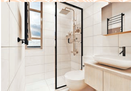
■浴室貫徹全屋白色主調。