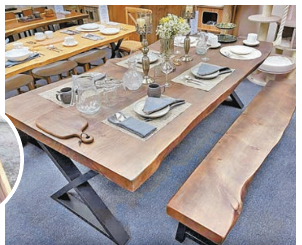
■新西蘭原木天然邊餐枱，售價5,000元起。