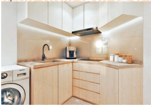
■廚房選用和風原木傢具。