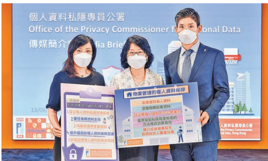
個人資料私隱專員公署昨發表調查報告。

訪客進入大廈要出示身份證登記，或住戶領取政府派發口罩時需填寫資料，這些都是日常生活中常見場景，但物業管理公司或未能妥善保管資料，導致侵犯私隱，市民須多加留意。個人資料私隱專員公署昨就4宗近期有關物管公司的投訴發表調查報告，指該4間物管公司不當收集、保留及使用業戶及訪客個人資料，其中有公司不必要地要求外賣員出示身份證才准進入，實情是工作證等其他身份證明文件亦可用作訪客登記。