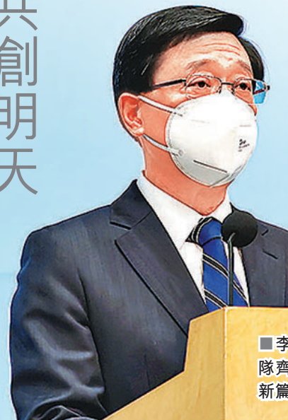
李家超表示會與管治團隊齊心協力，同為香港開新篇。

新一屆特區政府班子的21名司局長中，9人是現屆班子續任，包括留任的財政司司長陳茂波、保安局局長鄧炳強、政制及內地事務處處長曾國衛、財經事務及庫務局局長許正宇；另外，行政長官辦公室主任陳國基為候任政務司司長，發展局局長黃偉倫為候任財政司副司長，教育局局長楊潤雄為候任文化體育及旅遊局局長，教育局副局長蔡若蓮升任為候任教育局局長，環境局副局長謝展寰升任為候任環境及生態局局長。有6人為現職或近期退休的高級公務員，包括常任秘書長及部門首長，分別來自政務職系和專業職系。他們分別為候任政務司副司長卓永興、候任公務員事務局局長楊何蓓茵、候任發展局局長甯漢豪、候任房屋局局長何永賢、候任運輸及物流局局長林世雄、候任勞工及福利局局長孫玉菡。有6人為新加入政府，約佔團隊三成，包括候任律政司司長林定國、候任律政司副司長張國鈞、候任民政及青年事務局長麥美娟、候任醫務衛生局局長盧寵茂、候任商務及經濟發展局局長丘應樺、候任創新科技及工業局局長孫東、候任房屋局局長何永賢、候任發展局局長甯漢豪、候任勞工及福利局局長孫玉菡。