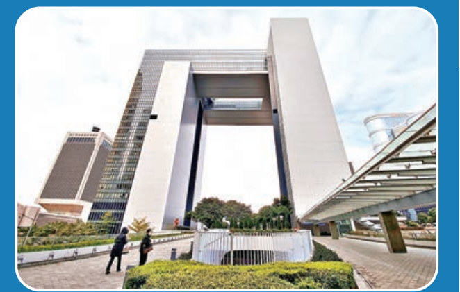
第六屆政府主要官員將於7月1日就職。圖為香港政府總部。

發言人表示，香港中聯辦作為中央政府駐港代表機構，將一如既往地全面準確貫徹執行「一國兩制」方針政策，全力支持行政長官和特區政府依法施政，堅決維護香港長期繁榮穩定。