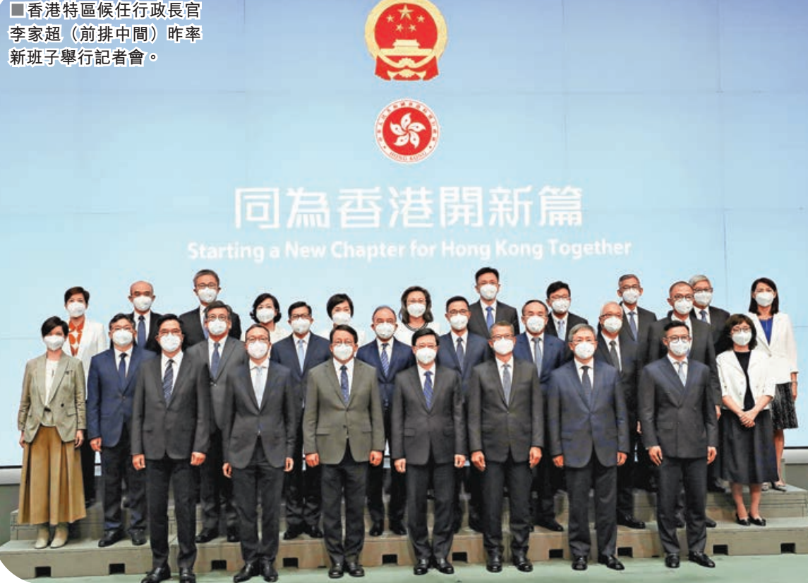
香港特區候任行政長官李家超（前排中間）昨率新班子舉行記者會。

業會計師、立法會議員；警務處處長蕭澤頤、入境處處長區嘉宏及海關關長何珮珊則續任。