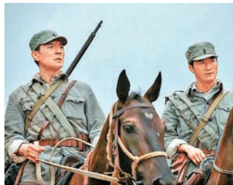
■《我和我的父輩》之《乘風》。