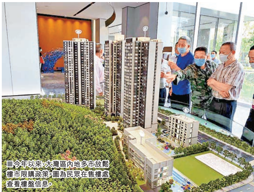
■今年以來，大灣區內地多市放鬆樓市限購政策。圖為民眾在售樓處查看樓盤信息。

粵港澳大灣區內地城市陸續鬆綁樓市限購政策。4日，大灣區城市東莞也「放大招」，明確除莞城街道、東城街道、南城街道、萬江街道、松山湖高新技術產業開發區外，其他區域暫停實行住房限購政策，無需進行購房資格核驗，即意味着東莞28個鎮街解除限購。值得注意的是，無論位於限購區域還是非限購區域，買家須取得不動產權證滿2年後方可進行交易轉讓。專家分析，東莞限購「鬆綁」理論上將加速部分從深圳等地湧來的「異地」置業需求，但因目前樓市總體預期較低，此類置業的數量較有限，預計對樓市成交不會造成太大影響。新政策雖然鬆綁了部分限購區域，但對於香港等境外人士購房標準並無鬆綁，目前無房港人仍只能在東莞購買一套住房。