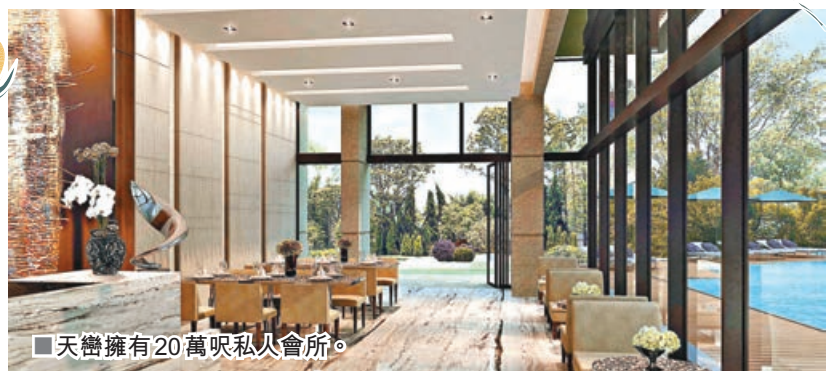
■天巒擁有20萬呎私人會所。