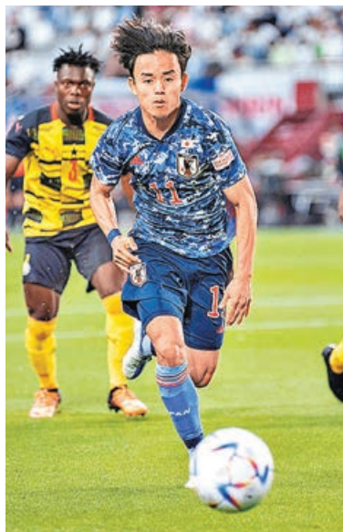
日本球星久保建英(前)始終未能在皇馬立足。

另外，阿根廷球星保羅戴巴拿已飛往葡萄牙，準備簽約加盟羅馬，並馬上參與該意甲勁旅的季前集訓。據知，戴巴拿將與羅馬簽約至2025年，稅後年薪為450萬歐元，每年最多可拿取150萬歐元獎金。