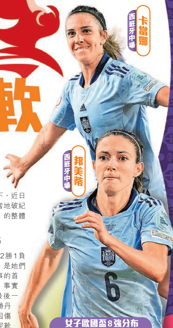
西班牙中場 卡當娜