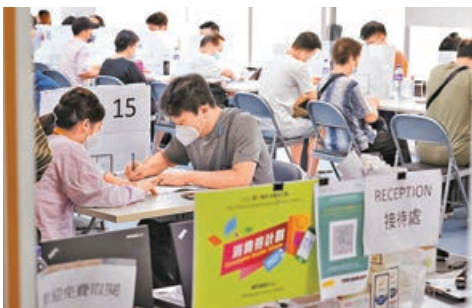
■大批市民早前辦理覆檢手續。

他指出，自從去年推出消費券計劃後，截至上月底，各電子儲值支付平台共增加約710萬個消費者賬戶，以及約13萬個商戶用家，有利香港發展電子支付，而消費券也有助社會氣氛轉好。