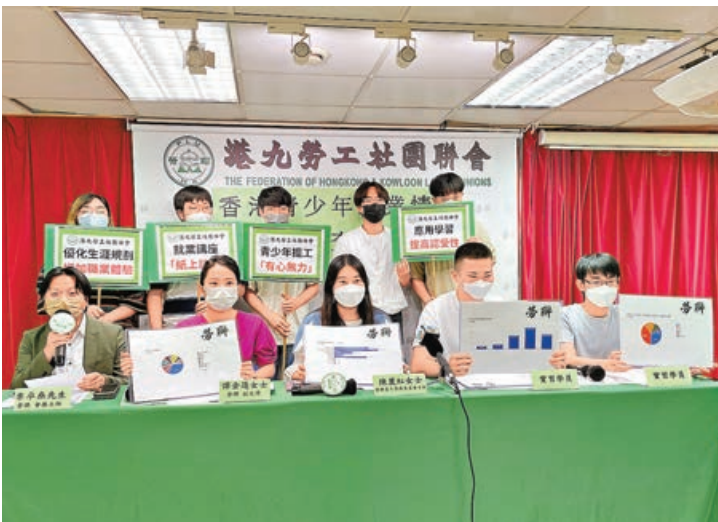
■勞聯昨舉行記者會公布調查結果。

受訪者認為在就業指導方面，最希望獲得應聘技巧及行業資訊（均為61.4%），模擬求職活動（32.7%）及行業體驗工作坊（29.7%）則最不受歡迎。調查又顯示，56.4%受訪者指清晰了解課程中有關職業教育的資訊，但認為相關資訊對規劃未來職業發展有幫助的受訪者只佔22.8%，反映教育局目前的生涯規劃課程，並未能有效達到課程目標。