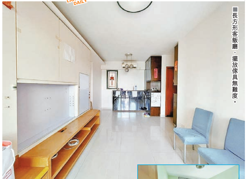
■長方形客廳飯廳，擺放傢具無難度。

海典軒由信和集團獨資發展，屋苑合共兩座，提供544伙及2個頂層特色單位，每戶設有環保露台。屋苑單位的實用面積由446至793呎不等，間隔為兩房和三房戶。