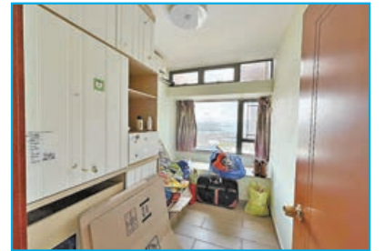
■長方形睡房放置大櫃後，仍有不少空間。