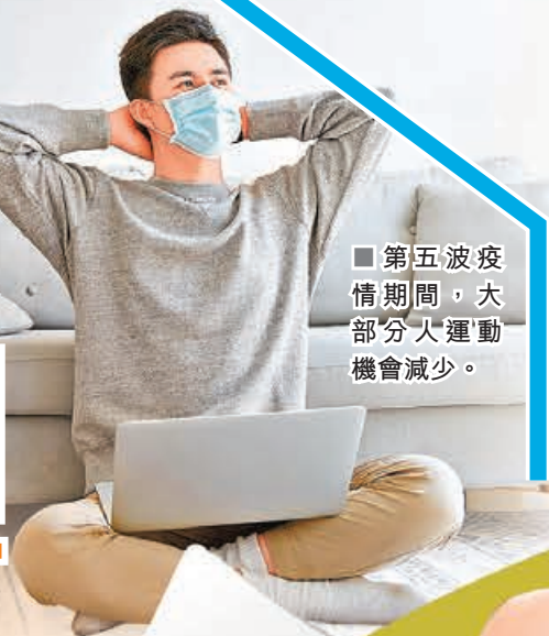
■ 第五波疫情期間，大部分人運動機會減少。

第五波疫情高峰期，絕大部分健身中心及體育處所都停運，市民宅家食多嘞多，運動機會減少，部分受到「疫情肥」困擾。因此疫情放緩後，市民對運動處所的需求急增，坊間有不少24小時全天候健身中心，成為不少運動愛好者的首選，亦有不少健身App重新設計，加入更多教學短片，務求令一眾運動愛好者宅家都能好好健身。