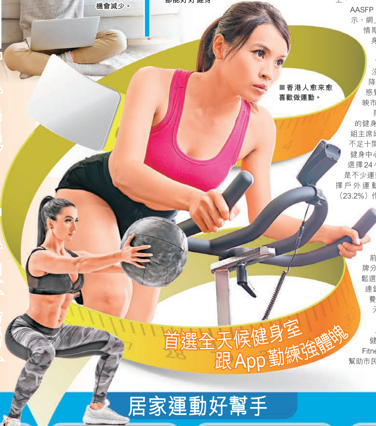
■ 香港人愈來愈喜歡做運動。

第五波疫情高峰期，絕大部分健身中心及體育處所都停運，市民宅家食多嘞多，運動機會減少，部分受到「疫情肥」困擾。因此疫情放緩後，市民對運動處所的需求急增，坊間有不少24小時全天候健身中心，成為不少運動愛好者的首選，亦有不少健身App重新設計，加入更多教學短片，務求令一眾運動愛好者宅家都能好好健身。