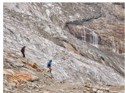
阿爾卑斯山因熱浪快速融雪，部分登山路線需封閉。圖為旅客路經「費冰川」。

蘇黎世大學冰川學者林斯鮑爾指出，很多因素導致了今年的冰川加速融化，首先是去年冬天的降雪量異常減少，其次是今年初撒哈拉沙漠的風沙令積雪變黑，之後就是5月至7月的連番熱浪襲擊。