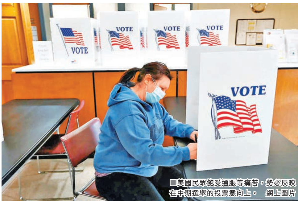
美國民眾飽受通脹等痛苦，勢必反映在中期選舉的投票意向。

美國經濟陷入技術性衰退，通脹居高不下，令總統拜登及民主黨陷入重大政治危機。彭博通訊社經濟師根據反映民眾對經濟狀況感受的「痛苦指數」(misery index)作預測，估計如果單純考慮經濟因素，民主黨在中期選舉將可能喪失最少30個眾議院議席，以及數個參議院議席，意味會完全失去參眾兩院控制權，拜登餘下兩年任期勢將淪為「跛腳鴨」。