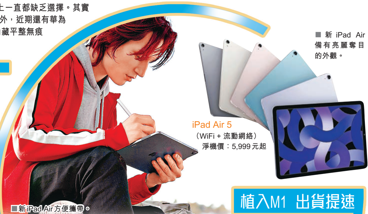
■ 新 iPad Air 備有亮麗奪目的外觀。