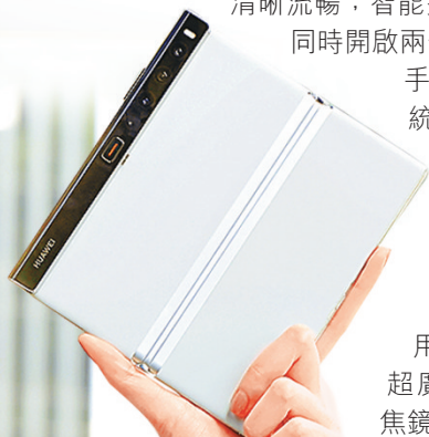
■ Mate Xs 2展開後屏幕達7.8吋。

手機採用雙旋鷹翼摺疊設計，當中的鉸鏈採用華為自研配方以及創新材質超輕超強鋼，承受力強，構造精巧，保證高強度的機身外仍能保持輕盈。屏幕展開時，桌面能自動延展，顯示全部內容，清晰流暢；智能多視窗體驗升級，通過一步分屏，同時開啟兩個應用程式平行操作，提升效率。手機搭載5,000萬像素原色影像系統，時刻捕捉真實色彩。此外，產品具獨特鏡像智拍功能，拍攝時雙屏能作即時預覽，拍攝兩邊的畫面；搭載新一代AI消除功能，輕鬆點選圖片中的物件即可精準消除，簡單易用。同時，透過1,300萬像素超廣角鏡頭和800萬像素長焦鏡頭的加持，遠方景物一觸即達，廣闊視野一鏡盡收。