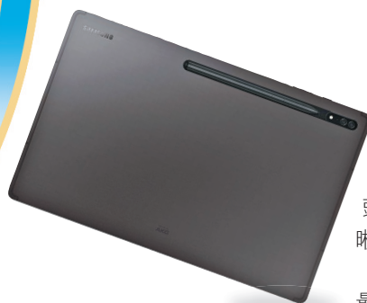
Galaxy Tab S8 Ultra 5G (16GB + 512GB) 售價：12,288元

三星推出Galaxy Tab S8 Ultra平板電腦，配備系列中最大的14.6吋屏幕、6.3毫米的極纖薄邊框，達至16:10的超高屏幕比例。S8 Ultra備有廣角及超廣角的雙前置鏡頭，並支援4K影像，令畫面更清晰。