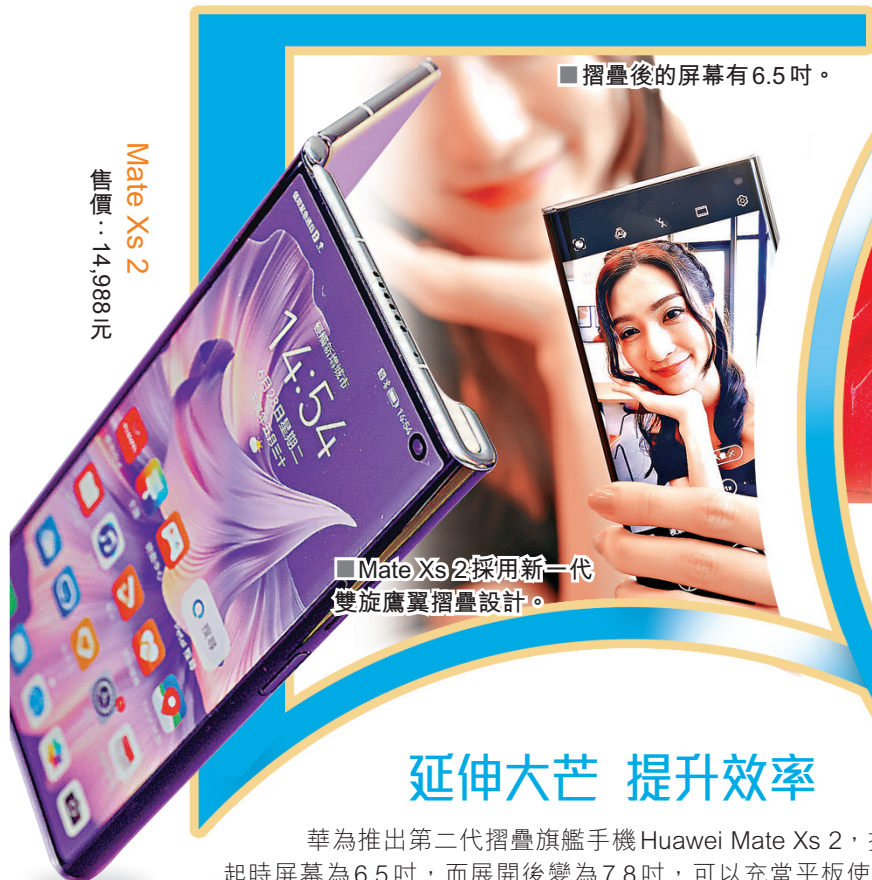
Mate Xs 2 售價：14,988元

雖然5G技術盛行，但支援5G流動通訊技術的平板電腦，在市場上一直都缺乏選擇。其實除Android OS和iPadOS兩大陣營的Galaxy Tab S8 Ultra和iPad Air 5外，近期還有華為全新的摺疊裝置Huawei Mate Xs 2。機身重量近乎旗艦智能手機，卻內藏平整無痕的7.8吋摺疊屏幕，若再配上5G網速，必定能展現出極速表現。