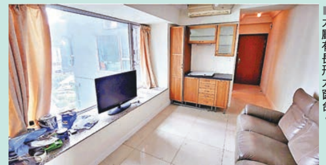
■大廳有長形大窗台。