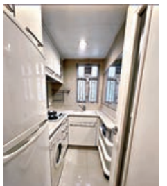
■廚房雪櫃、洗衣機、焗爐和煮食爐齊全。

發展商耗資1億5,000萬元設住客會所，位處5至7樓，面積約20萬平方呎。物業基座為16萬呎商場「宇晴匯」，設有通道接駁鄰近的屋苑昇悅居及泓景臺商場。