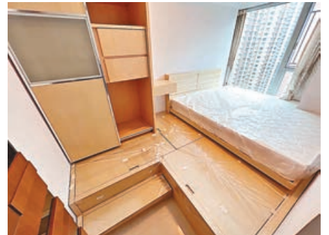
■主人房特別訂製地台床。