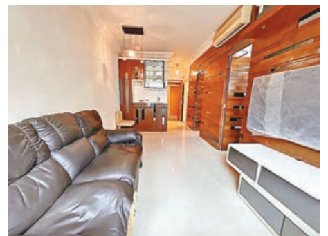
■長方形大廳可擺放大大張梳化。