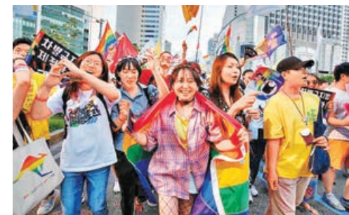
■韓國很多民眾信仰宗教，觀念保守，故改善LGBT權益方面進展不大。圖為首爾的同志遊行。

緬甸和新加坡之前一樣，緬甸也沿襲英國殖民時代的法條，同性戀可被罰款或判刑監禁。最後是越南，權益人士指出，越南的同性平權運動及社會接受度越來越高，有可能成為下一個推進同婚的地方。