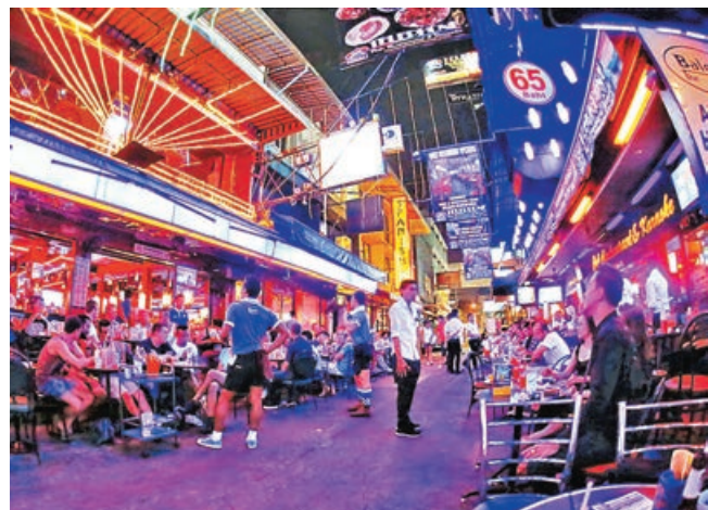
■泰國的LGBT生意活動非常蓬勃。圖為曼谷的同志酒吧，光顧民眾人山人海。

據《彭博》報道，研調機構LGBT Capital的數據顯示，LGBT社群旅遊估計為泰國貢獻了53億美元（約424億港元），佔泰國整體旅遊產業的8.4%，LGBT社群旅遊甚至為整個泰國經濟體貢獻了1.15%，佔比幾乎世界第一。