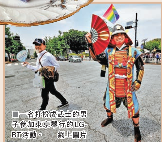
■一名打扮成武士的男子參加東京舉行的LGBT活動。網上圖片