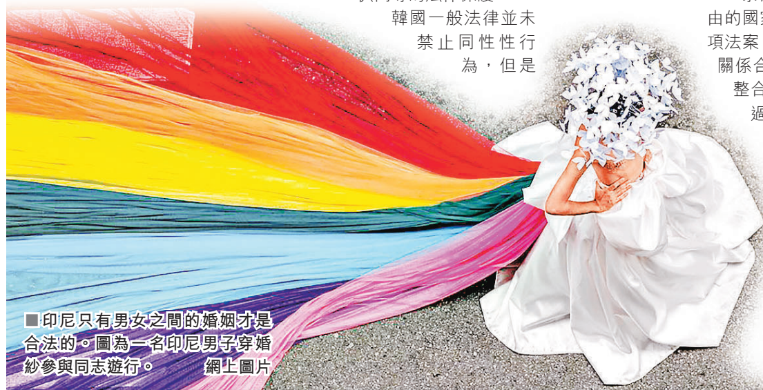
■印尼只有男女之間的婚姻才是合法的。圖為一名印尼男子穿婚紗參與同志遊行。

該國的軍隊刑法嚴格禁止男性士兵之間的性行為，即使在非執勤，放假期間也同樣禁止。若觸犯法律可判處最高兩年有期徒刑。《人權觀察組織》指出，韓國政府過去在聯合國會議上多次針對保護LGBT的措施投同意票，卻在該國改善LGBT權益方面進展不大。很多人認為這與該國人口很多信仰宗教，觀念保守有關。不過隨着社會的進展，社會的保守態度在慢慢軟化。