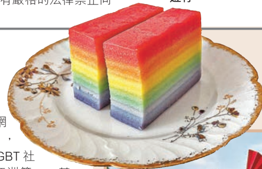
■印尼一間店舖製作的彩虹蛋糕。

但即使被認為是對LGBT社群最友善的國家之一，泰國因性傾向而導致的就業歧視仍時有所聞，且LGBT社群為泰國帶來的收入仍少於西班牙、美國及英國等國，顯示泰國仍然有大量的成長空間。