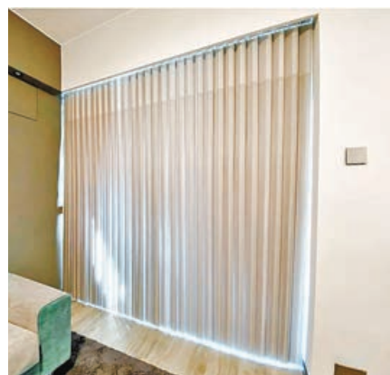
■ 紗簾濾光性效果極佳，陽光透過紗簾變得更柔和。