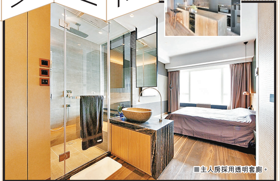
■ 主人房採用透明套廁。