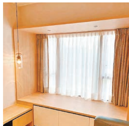
■ 紗簾常與布簾作配搭，以提升窗簾層次感，亦作調光之用。

The Curtain 最新引入來自日本的「定型加工技術」，務求讓布藝窗簾更有層次。而日本定型技術窗簾是採用超過 100℃ 高溫高壓技術熨燙布藝窗簾，全方位平均受熱，使窗簾持久定型，較手工熨燙更不易變形，而且高溫殺菌，可安心使用。