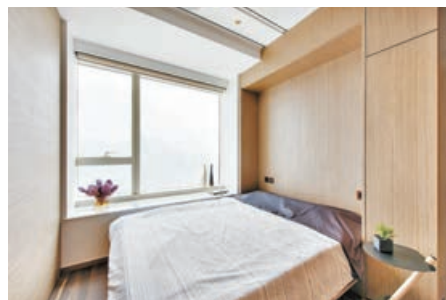
■ 睡房可欣賞無敵海景。