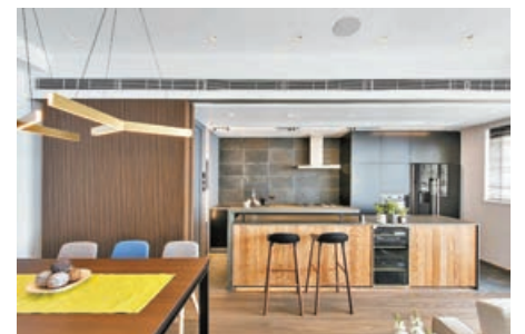
■ 開放式廚房設有移動趟門，趟門關閉時如同飯廳的特色牆；趟門打開時則可增加採光。