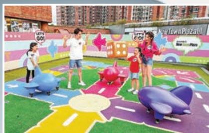
■巨型飛行棋競技場。