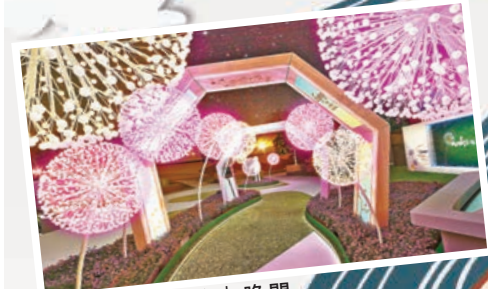
■「蒲公英小路」晚間更亮麗。