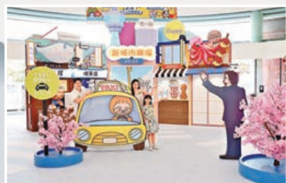
■Keigo大阪一町角色登場。