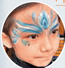
■中秋限定「特色面繪體驗」。

昂坪市集由即日起至9月18日搖身一變成為賞燈好去處，周圍掛上手繪燈籠和心形花燈，加上昂坪市集獨有的古色古香氛圍襯托下，讓賓客置身於花燈海之中。圓形手繪花燈陣由專上學院視覺藝術教育學系學生一筆筆親手繪畫而成，集心意及創意於一身。市民可於閃閃生光的半月裝置前留影。而心心相印心願亭則掛滿粉色系心形花燈，菩提許願樹