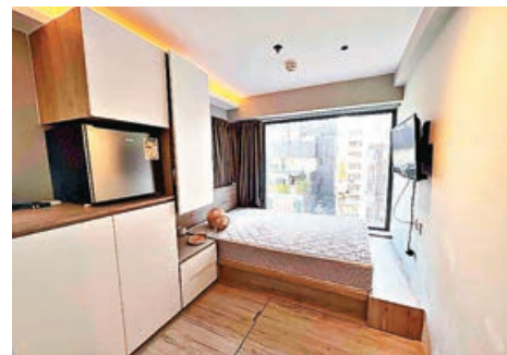
房間居住環境舒適。

先導計劃有兩個重要目的，首要是增加過渡性房屋供應，其次是幫助酒店和賓館業界，度過在2019冠狀病毒疫情下嚴峻的經營環境。扶貧委員會於2021年2月26日批准從關愛基金撥款9,500萬元，資助非政府機構推行先導計劃，以使用合適的酒店和賓館房間提供約800個過渡性房屋單位。前運輸及房屋局轄下的過渡性房屋專責小組隨即展開工作，並於2021年4月1日啟動先導計