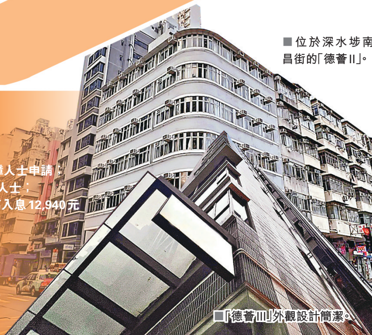
「德蒼III」外觀設計簡潔。