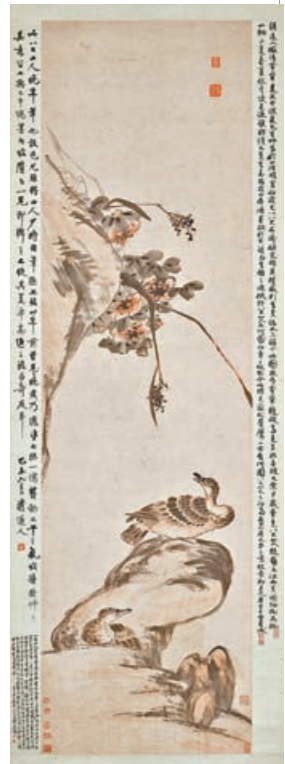
■ 朱耷(八大山人)《芙蓉蘆雁》。

現分批呈獻，機會難得。其他亮點還有「玉齋」舊藏金農《墨梅》(估價1千200萬至2千萬港元)，及八大山人《芙蓉蘆雁》(估價800萬至2千萬港元)等。