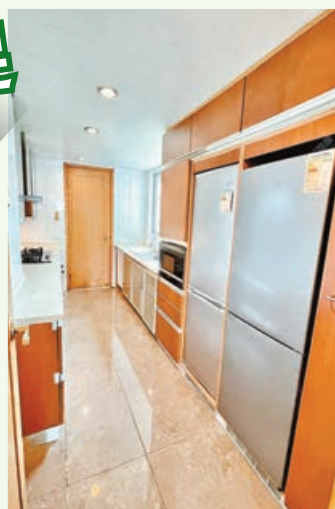
■廚房可擺放大型雪櫃，洗菜盆和煮食爐分處兩邊櫃枱。