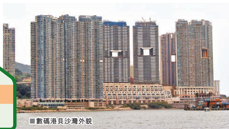
■數碼港貝沙灣外貌

貝沙灣是位於港島南區薄扶林鋼線灣數碼港沿岸的一個大型豪華住宅屋苑，由盈大地產發展。物業擁有極高私隱度，戶戶坐享環海景觀，無邊際遠洋景。