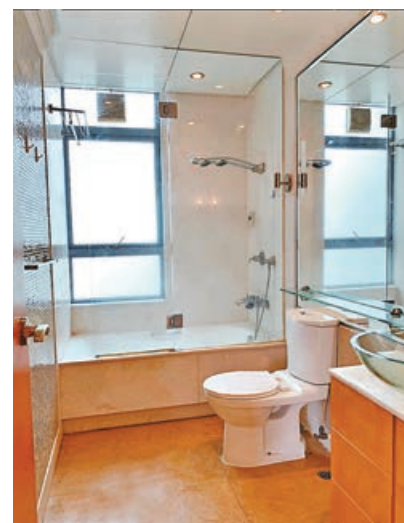
■浴室空間夠大，浴缸旁有大玻璃窗，可邊浸浴邊欣賞海景。