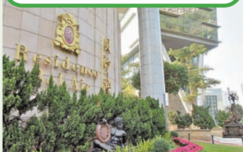
■貝沙灣住宅大門口。