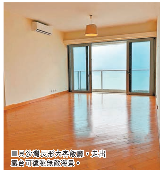
■貝沙灣長形大客飯廳，走出露台可遠眺無敵海景。

貝沙灣共分六期，第一期及第二期各共有7座樓宇，其中第二期命名為南岸；第三期為貝沙灣洋房，由18間獨立屋組成；第四期則共有8座樓宇，命名為南灣，間隔只有2房2廳以上的大單位；第五期由29間獨立屋組成，命名為貝沙山徑洋房；第六期是8幢呈波浪型的住宅。