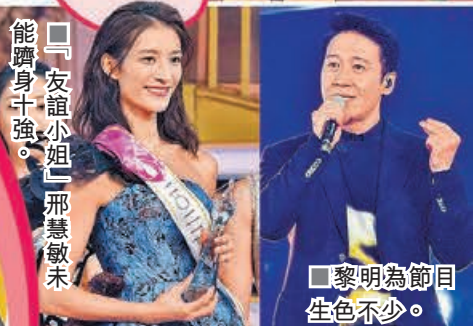
■黎明為節目生色不少。