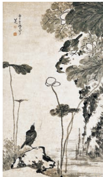
清代朱耷《荷塘雙鳧圖》