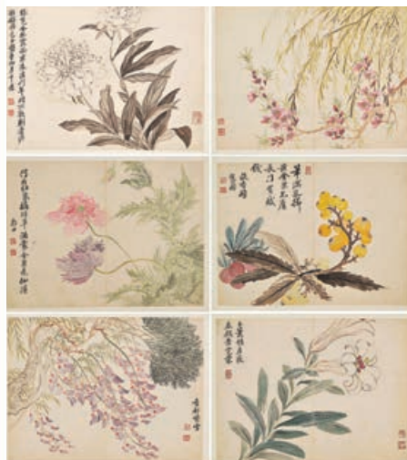
清代惲壽平《花果圖冊》(部分)

時期。宋徽宗的花鳥畫，具有極強院體畫藝術特色。在畫院之外，以水墨表現為主的寫意花鳥畫已經出現，以梅蘭竹等抒發「性靈」，亦稱「文人畫」或「士大夫畫」，成為與院體畫迥然不同的繪畫格調。