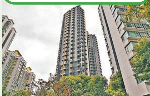
■尚悅·嶺(中)樓齡較新。