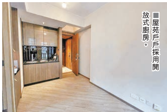
■屋苑戶戶採用開放式廚房。