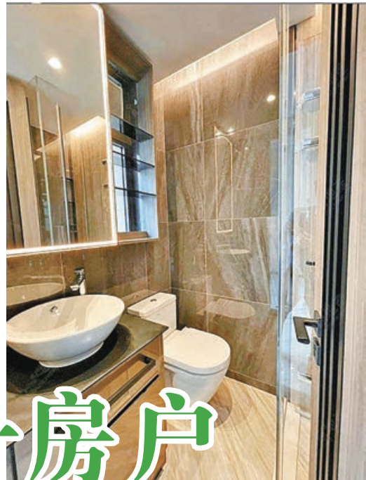
■廁所大型玻璃鏡配合柔和燈光。