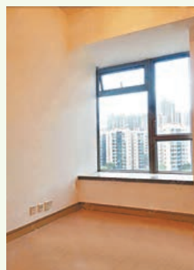
■房間設有玻璃窗台，光線充足。