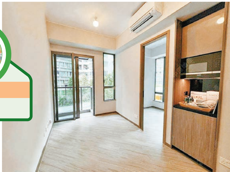
■長方形大廳連接露台。