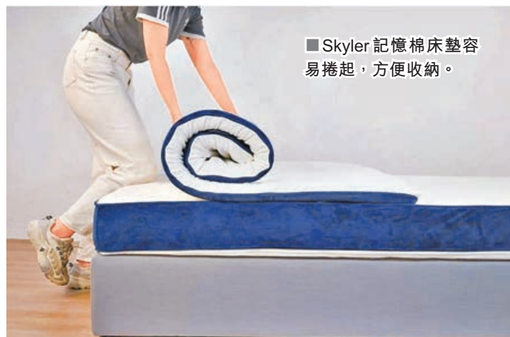
■ Skyler 記憶棉床墊容易捲起，方便收納。

Skyler 記憶棉床墊透氣及散熱度高，容易捲起，方便收納，且抗菌、防塵蟎、防過敏等。當你家中的床褥軟硬度不合適，開始出現退化現象，或已接近它的使用極限，Skyler 記憶棉床墊就可以幫到你！