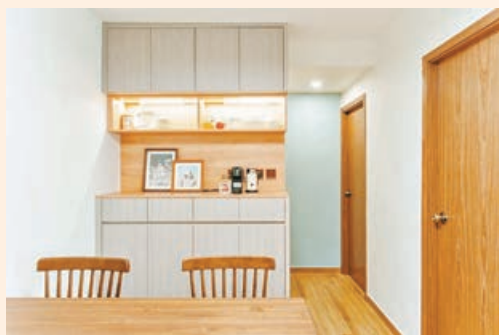
■客飯廳淺灰木色儲物櫃，配置玻璃及柔和燈光。