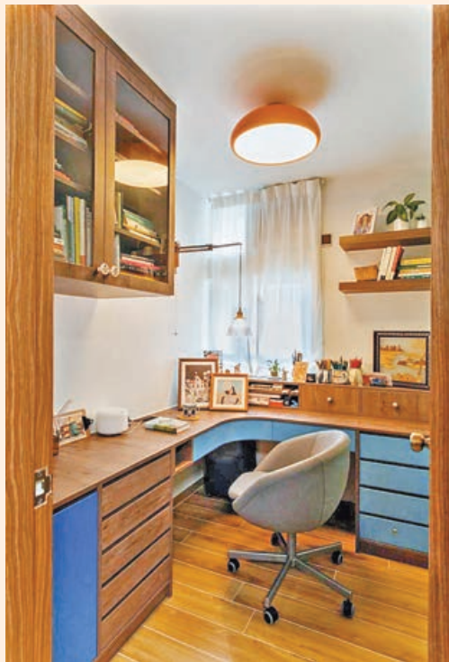
■日式懷舊風書房，令作為插畫師的戶主可盡情投入創作。