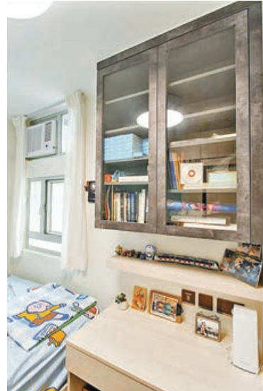
■主人房有裝飾書櫃及工作書枱。