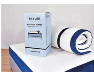
■ Skyler 記憶棉床墊透氣及散熱度高。

睡佳樂公司研發的 Skyler 床墊選用優質記憶棉物料，能即時為你的床褥提升舒適度及承托力，有兩種軟硬度可調節，令你睡眠質素大大提升，輕輕鬆鬆一覺瞓天光。