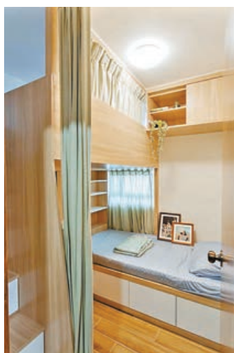
■戶主老人家和工人姐姐的睡房。