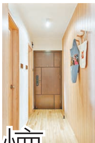
■大門口走廊配以裝飾木牆。