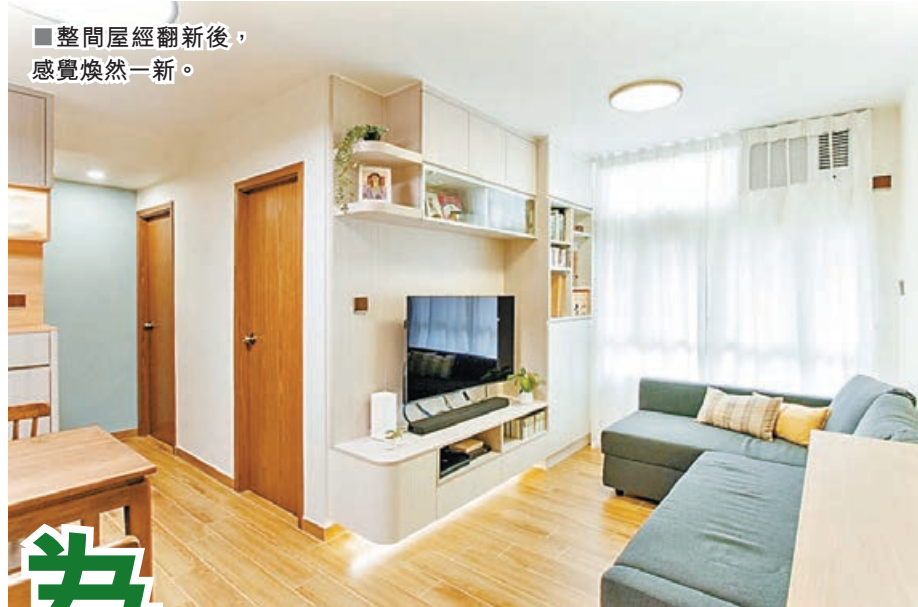
■整間屋經翻新後，感覺煥然一新。