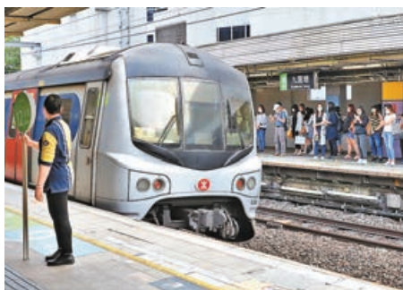
■施政報告提出多項鐵路基建項目，圖為九龍塘站。

東九龍線是《鐵路發展策略2014》提出方案之一，最初方案是興建約7.8公里長的重鐵線路，但消息人士表示，有關走線會經過傾斜的山體，不適合建設重鐵，將會改為高架無軌捷運，技術上會參考包括內地的無軌電車等。無軌捷運的走線亦會較原計劃改變，預計不會駛入將軍澳，具體方案或於明年上半年公布。