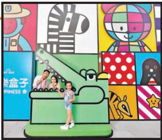
■鱷魚巨齒陷阱打卡位。

香港作為中外文化交流的橋樑，就是要在海外華人的心目中建立起一個正面文化交流使者的角色，爭取海內外華人華僑「愛國愛鄉」向心力，促進「一帶一路」沿線民心相通及人文交流。透過具有「思想性，藝術性和娛樂性」的優秀影視作品，吸引海內外華人，以及世界，特別是「一帶一路」沿線觀眾，發揮對外文化交流窗口作用。