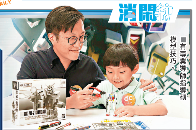
■有專業導師指導模型技巧。