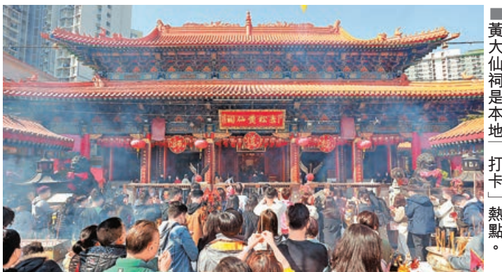
■黃大仙祠是本地「打卡」熱點。