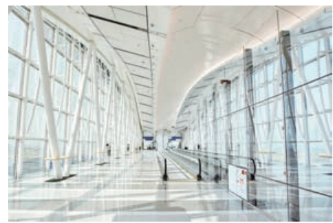
■「天際走廊」全長200米。

天際走廊組件由廣東中山運送到港，在機場內的組裝工場完成焊接。機管局表示，走廊原訂2020年落成，預算約9億元，但因疫情影響及過往幾年航班需求低，延期至今年啟用。