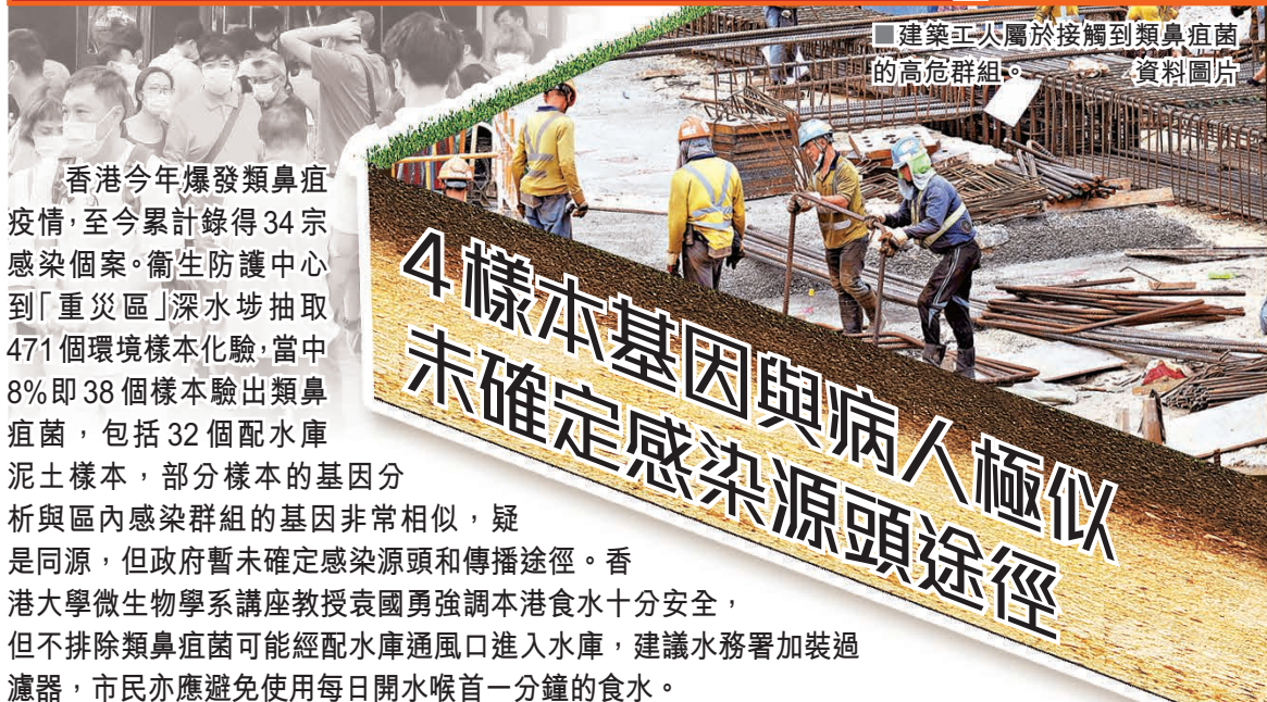
建築工人屬於接觸到類鼻疽菌的高危群組。資料圖片

香港今年爆發類鼻疽疫情，至今累計錄得34宗感染個案。衛生防護中心到「重災區」深水埗抽取471個環境樣本化驗，當中8%即38個樣本驗出類鼻疽菌，包括32個配水庫泥土樣本，部分樣本的基因分析與區內感染群組的基因非常相似，疑是同源，但政府暫未確定感染源頭和傳播途徑。香港大學微生物學系講座教授袁國勇強調本港食水十分安全，但不排除類鼻疽菌可能經配水庫通風口進入水庫，建議水務署加裝過濾網，市民亦應避免使用每日開水喉首一分鐘的食水。