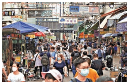
深水埗發生多宗感染類鼻疽菌個案。

經過細菌培植及全基因分析，發現其中4個配水庫泥土樣本，與區內病人的類鼻疽伯克氏菌高度同源，認為兩者有關聯，但暫未能確認感染及傳播途徑。他指出，追蹤各患者感染途