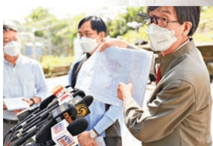
港大微生物學系講座教授袁國勇早前到蝴蝶谷配水庫視察。資料圖片

袁國勇指出，巡視過深水埗配水庫環境，配水庫的頂部有多個通風口，不排除泥土內的類鼻疽菌經通風口進入水庫，「當打風落雨時，泥土內的類鼻疽伯克氏菌經過通風口進入水庫，我再重申一次，這個只是其中一個高危因素，我們並沒有證實到，因為從來在香港的食水中找不到類鼻疽伯克氏菌的基因，或者是種出（菌）來，從來沒有發生過。」他認為，水的氯含量及配水庫的檢查工作已做得很好，沒有滲漏，因此未能證明配水庫泥土中的病菌是如何感染患者。他再強調，所有食水樣本均未能培育出類鼻疽菌，重申香港食水十分