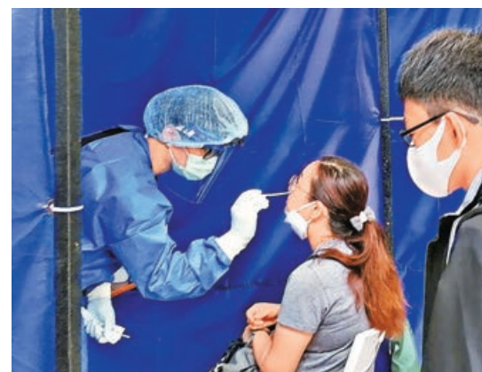
■ 免費核酸檢測不再「擦鼻」。資料圖片

收費方面，各間承辦商的收費不一，「標準自費服務」由90元至150元不等；「特快自