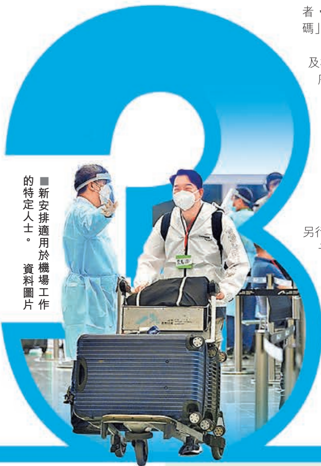
■ 新安排適用於機場工作的特定人士。資料圖片

眾市民更易適應政府的檢測新安排。在「安心出行」獲取「檢測登記碼」的3個小步驟，輕鬆簡單，讓一提升採樣效率。到底應如何取得「檢測登記碼」？本報特別整理出為採集「咽喉拭子樣本」，即採樣時只需要「擦喉嚨」，可望進一步核酸檢測要先預約或使用「檢測登記碼」，而免費核酸檢測亦將改早前，政府公布社區核酸檢測新安排，由即日起市民做免費