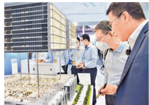
粵港澳(香港)衛星智能製造中心沙盤在航展首次亮相，吸引眾多專業人士觀摩。

粵港澳大灣區不少城市都擁有強大生產力，但該中心選擇了落戶香港，在將軍澳創新園先進製造中心開設香港首條衛星生產線。他補充，中心目前已聘用多名本地大學生，「從這個角度來看，不論是本地學生就業，提供本地科研崗位等，中心都能幫忙推動起來。」