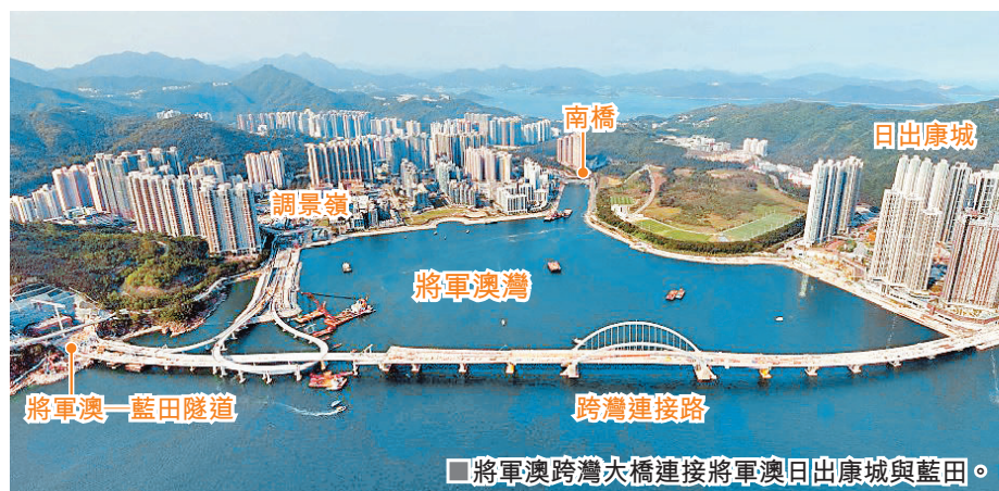
將軍澳跨灣大橋連接將軍澳日出康城與藍田。

將軍澳跨灣連接路（跨灣大橋）及將軍澳—藍田隧道即將竣工。有消息指，大橋及隧道暫定下月 11 日同步通車，可望紓緩區內繁忙時間交通負荷，而往來將軍澳及東九龍將可減省約 20 分鐘車程。民建聯新界東南立法會議員李世榮希望政府盡早做好宣傳工作，避免通車初期出現混亂，並於通車同日起豁免將軍澳隧道收費。西貢區區議員方國珊估計，至少三成車流會改用將藍隧道，有助緩解將軍澳隧道塞車問題，但擔心繁忙時段交通樽頸或會轉移至其他位置。