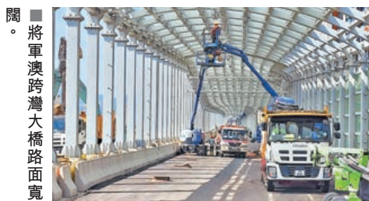
將軍澳跨灣大橋路面寬闊。

將軍澳跨灣連接路（跨灣大橋）及將軍澳—藍田隧道即將竣工。有消息指，大橋及隧道暫定下月 11 日同步通車，可望紓緩區內繁忙時間交通負荷，而往來將軍澳及東九龍將可減省約 20 分鐘車程。民建聯新界東南立法會議員李世榮希望政府盡早做好宣傳工作，避免通車初期出現混亂，並於通車同日起豁免將軍澳隧道收費。西貢區區議員方國珊估計，至少三成車流會改用將藍隧道，有助緩解將軍澳隧道塞車問題，但擔心繁忙時段交通樽頸或會轉移至其他位置。