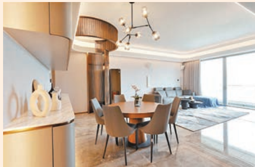
■客飯廳柔和燈光，與戶外陽光相映成趣。