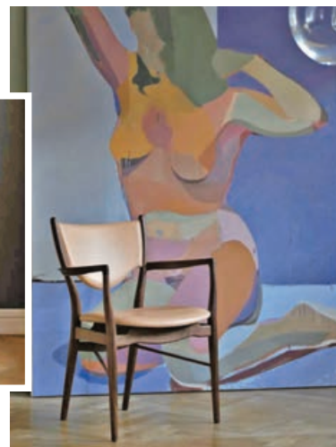
■46 Armchair（扶手椅）使用簡單的線條。