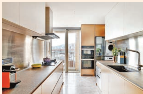
■廚房附設有工作露台外，裏頭空間充足，讓女主人可一展廚藝。