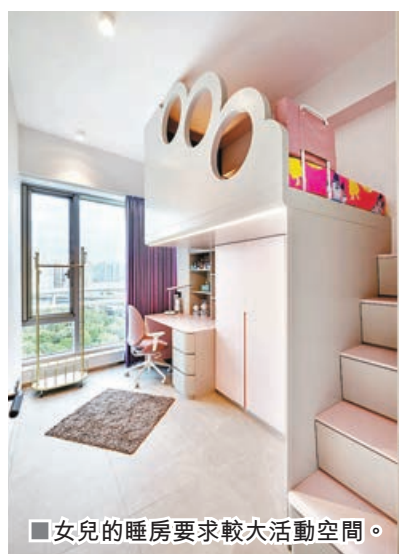
■女兒的睡房要求較大活動空間。

是次由Tade Design Group Ltd進行裝修設計的單位位處九龍美孚寶輪街1號曼克頓山，早前剛奪得Titan Property Award金獎，單位間隔為四房兩廳兩浴室，屋主為一對夫婦及一子一女。由於兒子跟女兒年紀尚小及歲數相差幾年，為了配合他們成長需要，在空間上的規劃均有所不同，例如女兒6歲仍然需要比較多的活動空間，因此設計師將女兒粉紅色的睡