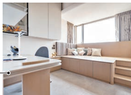
■兒子房間設計一體化書枱，方便溫習。

本單位的设计挑戰在於層數較低，因此並沒有太多自然陽光進入屋內，我們沒有用假天花設計的燈光效果，因為這樣會令整體空間更具壓迫感，我們反而用了上下LED燈帶，並配以智能調節器，能隨着屋外陽光減少增加室內燈光相對提光或減暗，亦更能營造出溫馨氣氛。