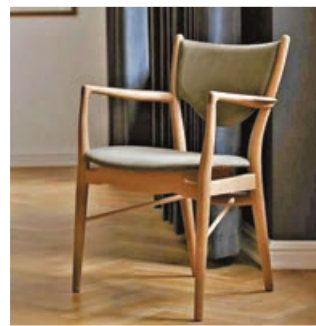
■大師傑作展現出扶手椅的輕盈感。

Juhl使用簡單的線條，座椅的框架和坐墊錯開，展示了扶手椅的輕盈感，同時舒適地將身體承載着。以上大師級藝術扶手椅在傢俬和家居裝飾專門店Outofstock有售。