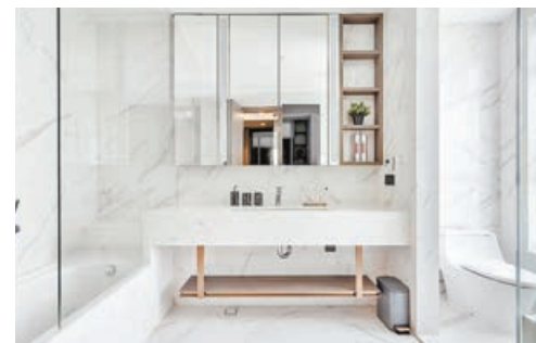
■主人房套廁特別用了白色雲石擴闊空間感。