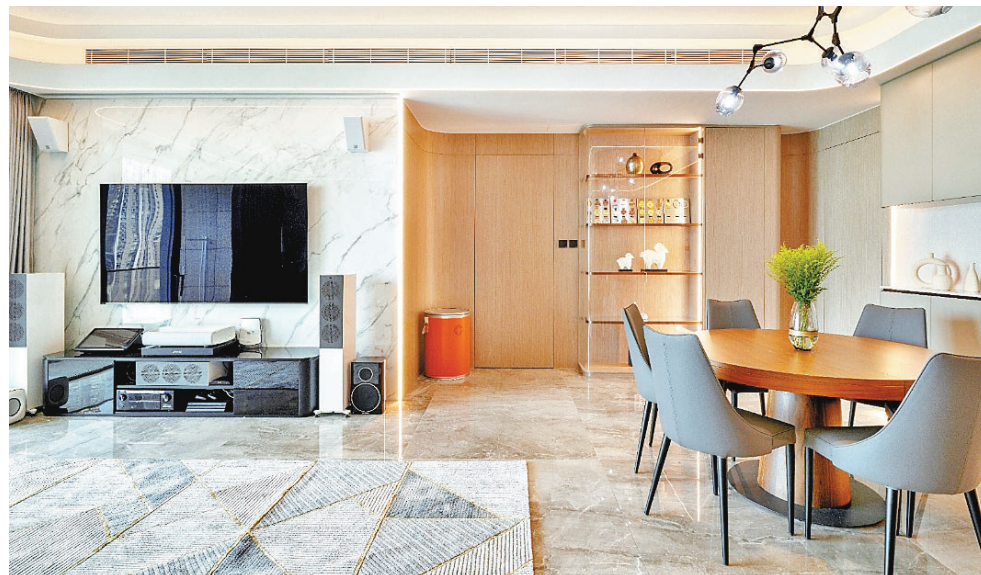
■大廳寬敞整潔，散發溫馨感覺。