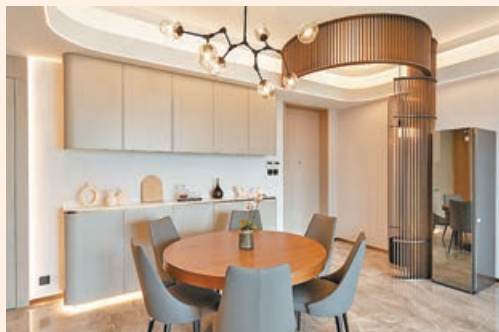
■為了提高私隱度，在玄關位加裝了一幅玫瑰金弧形欄柵屏風。