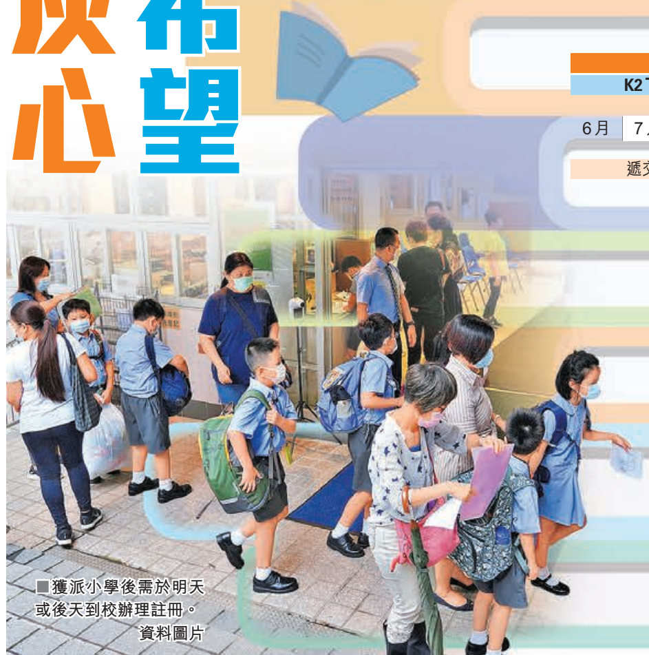
■獲派小學後需於明天或後天到校辦理註冊。

小一「統一派位」被稱為「大抽獎」，事關學童派位主要取決於電腦隨機排序，排序愈前，愈早派位，派中心儀學校的機會就愈高。不論子女成績多好，會多少種外語等，都無法影響排名。相反，即使成績差，但只要運氣好，編碼被抽中排前面，亦有機會獲派入名校。因此，如家長打算為子女報讀官立或津貼小學，無須太介懷在讀幼稚園的成績及表現，因幼稚園的教學質素，與其升小前景是沒有任何關係。