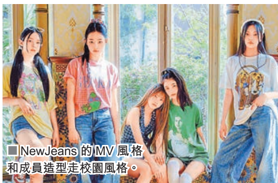
■NewJeans 的 MV 風格和成員造型走校園風格。

除了由傳奇級製作人打造外，NewJeans 的作品也獲得 K-POP 樂迷的認可，三首主打歌全部進入 Melon 榜單前 10。成為史上首個出道當天就突破 20 萬張專輯銷售量的女團。除了音源上有好成績外，組合的時尚資源也是相當亮眼，出道第二天就受到 Chanel 美妝活動邀請，全員穿上品牌服飾出席現場。成員 Hanni 最近更成為 Gucci 的新任品牌大使，組合成員的未來發展無可限量！