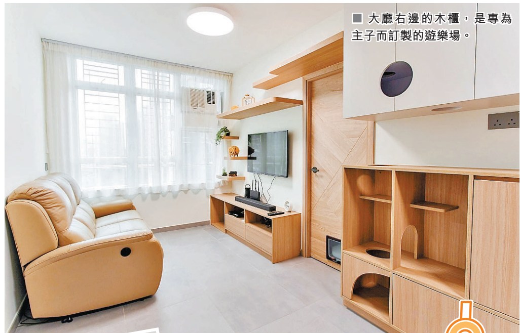
大廳右邊的木櫃，是專為主子而訂製的遊樂場。