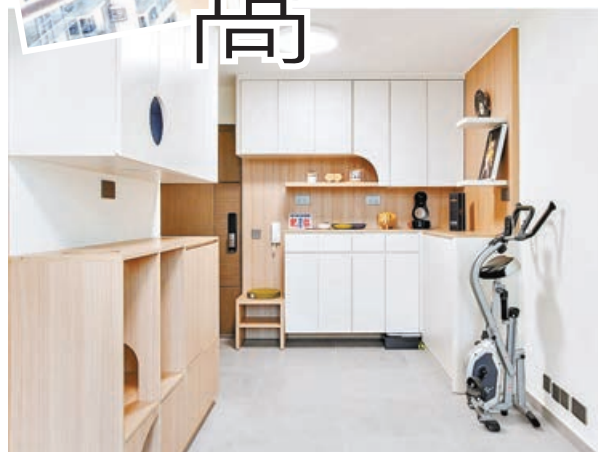
打開大門入內，迎面的是木製的C字櫃和吊櫃等。