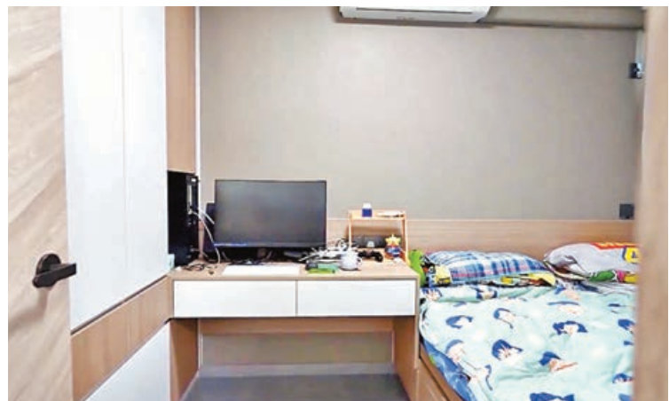
睡房大床、書枱和衣櫃都是木系傢具。