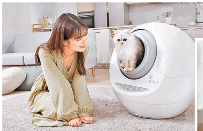
主子專用的廁所，舒適又衛生。

MEET 2代全自動電動智能貓廁所採用UV燈物理照射滅菌，產品有微生物分析中心權威檢測報告，99.9%紫外線殺菌率。產品並自設生物雷達防火牆系統，四周及艙內均為雷達監測範圍，感應到寵物將立即停止運轉，從根本上杜絕危險發生。