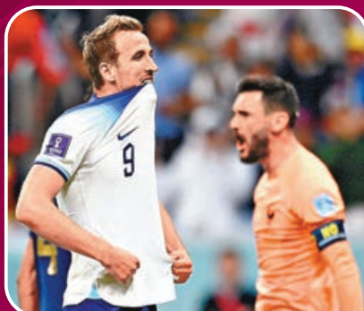
■哈利卡尼（左）射失極刑後，表情極度失望。