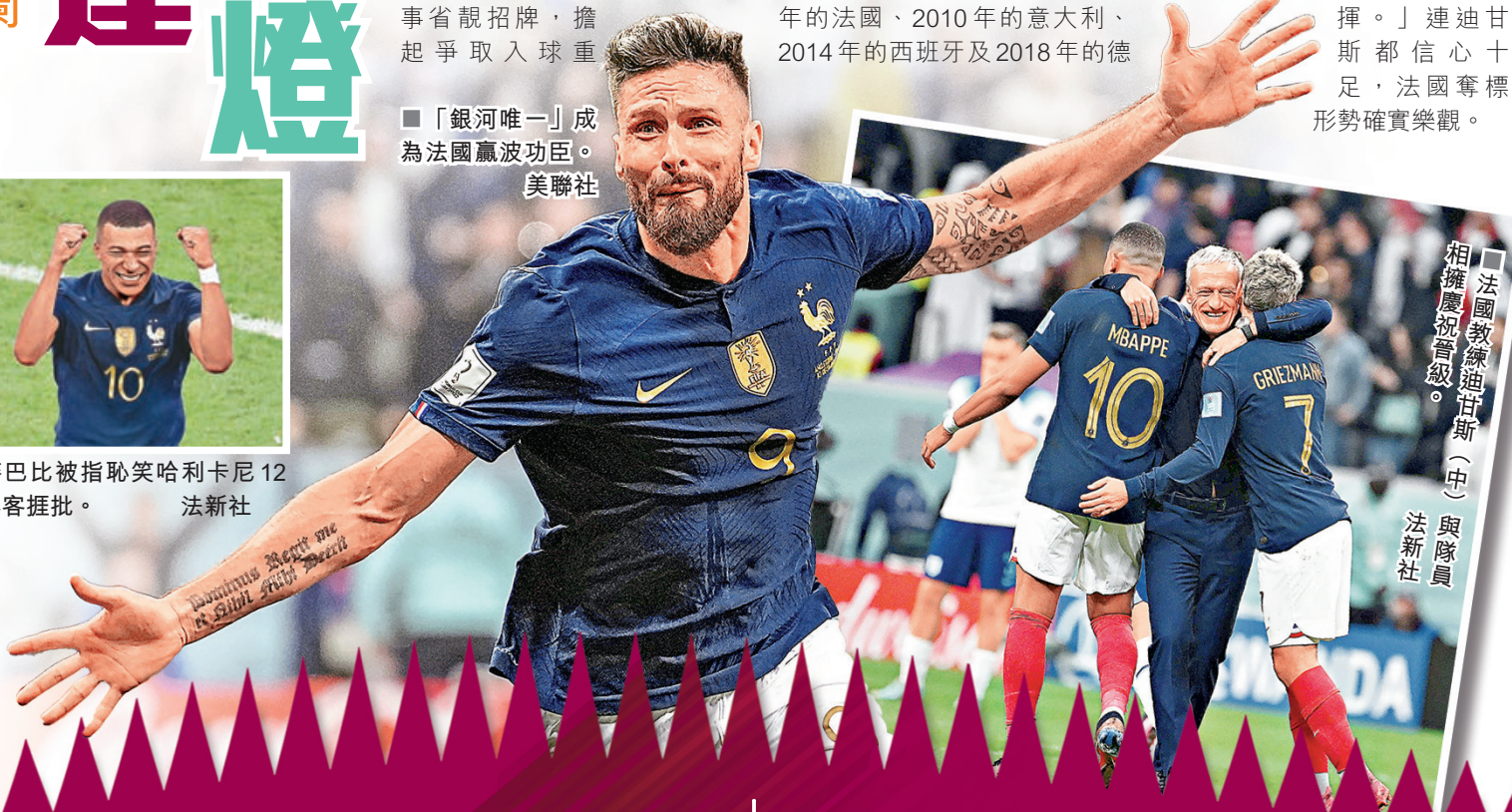
■法國教練迪甘斯（中）與隊員相擁慶祝晉級。