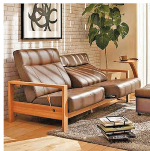
■日本 Karimoku 可調整角度、坐姿梳化。