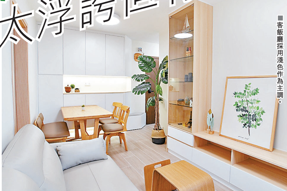
■客飯廳採用淺色作為主調。