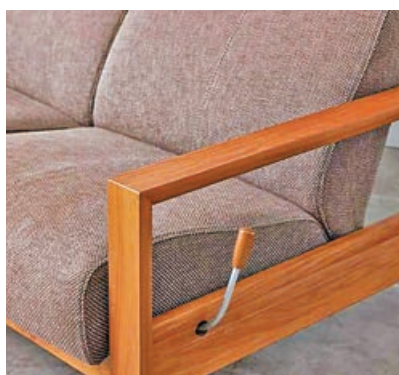
■梳化兩側都有推桿。

這款梳化尺寸和一般梳化相若，側面有推桿可以隨意控制座椅的斜度，操作簡單，不需要特別移動梳化位置，也可以將座椅躺平，節省位置。頭部的靠墊也可活動，讓你自由調整最舒適的坐姿，享受你的休息時間。該款梳化現已登陸傢俬店 OUT OF STOCK - THE BASE。