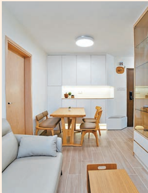
■飯廳除可放置四人飯枱外，並配置高身儲物櫃。