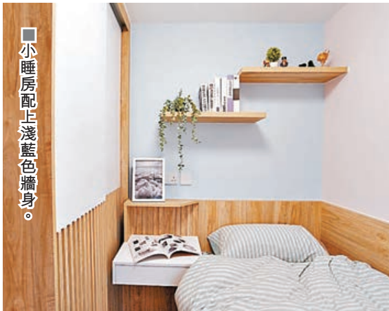
■小睡房配上淺藍色牆身。