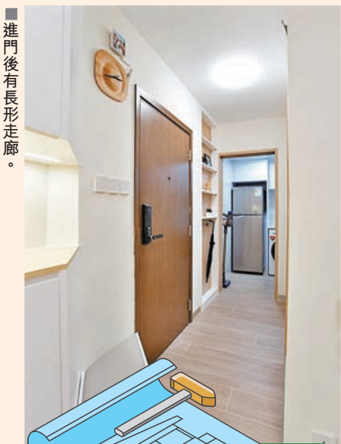
■進門後有長形走廊。