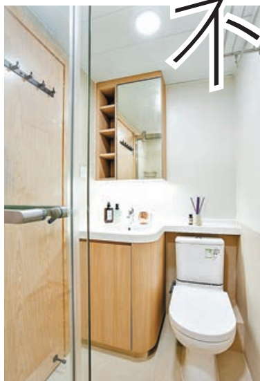
■洗手間地櫃特意用上圓邊。