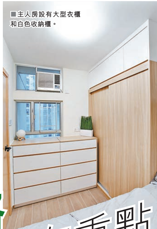
■主人房設有大型衣櫃和白色收納櫃。