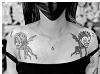
■漫畫《Death Note》中的死神角色。

來找 Yingo 紋上日式漫畫圖案的客人，三分之二是男性，「當然也會有女性客人要求紋少年漫畫的圖案，例如龍珠、鋼鍊、海賊王等，可見不乏女性讀者對日本漫畫的愛好。」