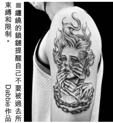
■繼續的鎖鏈提醒自己不要被過去所束縛和限制。Dabbie 作品

Dabbie 的紋身作品中的女性神態大都呈現出寧靜而空洞的感覺，「這也一種豐富畫面中的留白，即便是暗黑風格，紋身後賦予的意義是來自客人自己，別人怎樣看不重要，重要的是自己想表達什麼。」