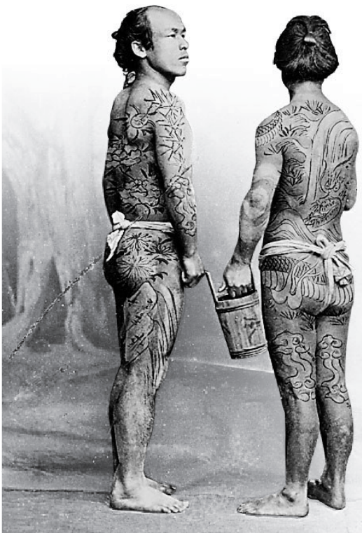
■日本江戶時期的紋身。網絡圖片