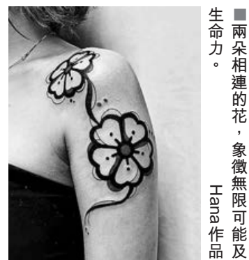
■兩朵相連的花，象徵無限可能及生命力。Hana 作品

對 Hana 來說，紋身是追求自己內心的表達，「家紋」有家族的概念，而花則有不同的花語，無論男女都可以通過「家紋」元素，將自己想表達的花紋在身上。