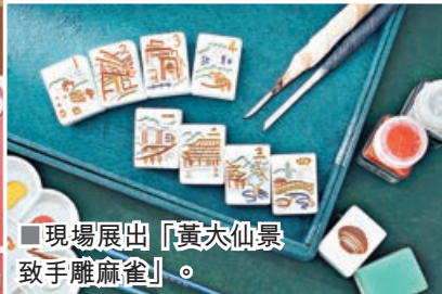
現場展出「黃大仙景致手雕麻雀」。