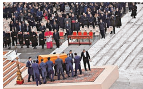
本篤十六世靈柩安放在梵蒂岡聖伯多祿廣場舉行葬禮彌撒。

已故榮休教宗本篤十六世的葬禮於昨日在梵蒂岡聖伯多祿廣場舉行，約6萬多名信眾到場參禮，包括多國元首。儀式由教宗方濟各主持葬禮彌撒，是200多年來首次由現任教宗主禮，約400多名主教及4000名司鐸在祭壇前公祭。本篤十六世家鄉德國和意大利均派出官方代表團出席。