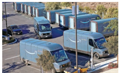
亞馬遜裁員主要涉及電商和人力資源部門。圖為亞馬遜的運輸貨車。

為控制成本，公司已將計劃裁員人數提高至「略高於1.8萬人」，大部分裁員將針對該公司的商店部門（包括其核心電商業務）以及PXT部門（即人力、體驗和技術部門）。