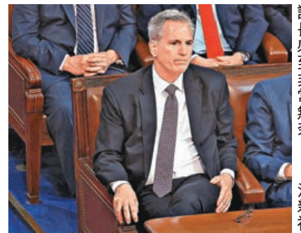
麥卡錫對多輪投票未能選出議長感到非常無奈。