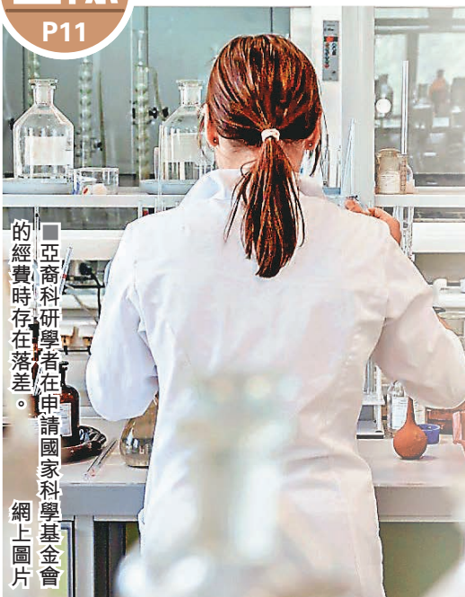
亞裔科學者在申請國家科學基金會的經費時存在落差。網上圖片