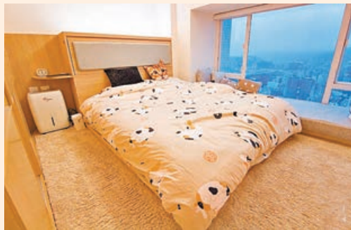
■主人房設地台，並鋪上地氈，增加收納空間。