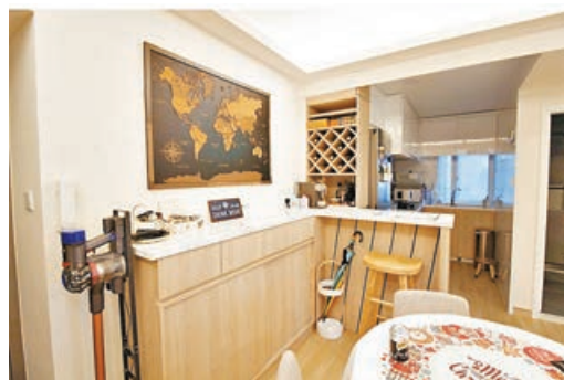
■客飯廳儲物櫃連特色吧枱連接廚房，再配上日式小圓桌。

因為大門對正客廳，所以加上屏風阻隔一下，屏風隱藏酒櫃的設計實用美觀，因為單位原則，在梳化背位置有空隙，所以在梳化背後加了上下儲物櫃拉直客廳，同時也能放置戶主的小物及珍藏相片。