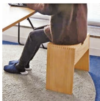
■疊椅承重力強，可當作座椅。

白、赤色、青瓷、群青、自然色及黑色等 6 種顏色選擇。就算家中沒有小孩，也可以用作朋友聚會來家時實用的疊椅或茶几。