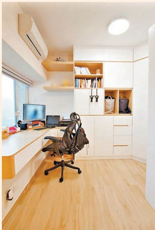
■窗台變書枱設計節省空間。