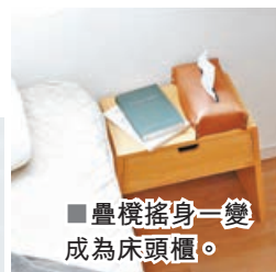
■疊椅搖身一變成為床頭櫃。