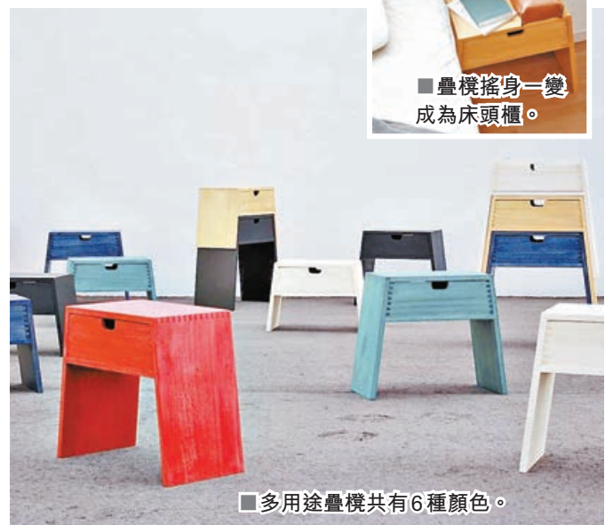
■多用途疊椅共有 6 種顏色。