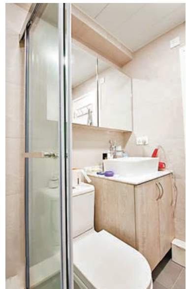
■廁所和淋浴間由玻璃趟門分隔開。

客廳旁原有的房間改為高櫃簡單牆身，開放式書房及衣帽間，書枱騎窗台設計節省空間，又能在使用書枱時飽覽窗外夜景。主人房全房地台，增加收納空間，衣櫃簡約全淺木色設計，濃厚的日式風格。