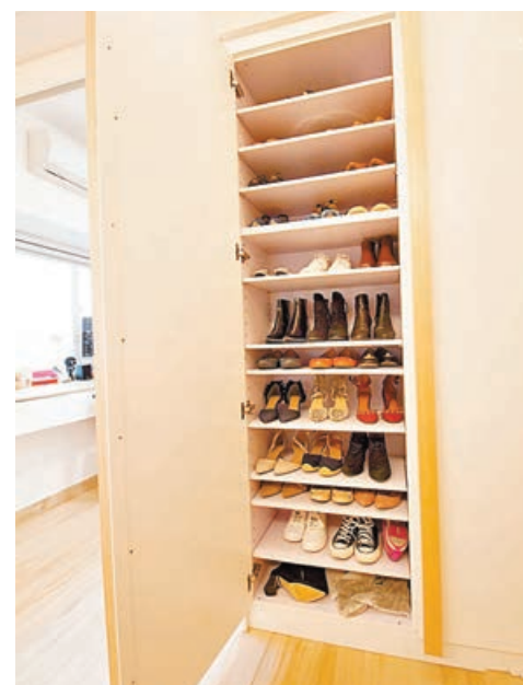
■度身訂造的入牆式鞋櫃。

客廳旁原有的房間改為高櫃簡單牆身，開放式書房及衣帽間，書枱騎窗台設計節省空間，又能在使用書枱時飽覽窗外夜景。主人房全房地台，增加收納空間，衣櫃簡約全淺木色設計，濃厚的日式風格。