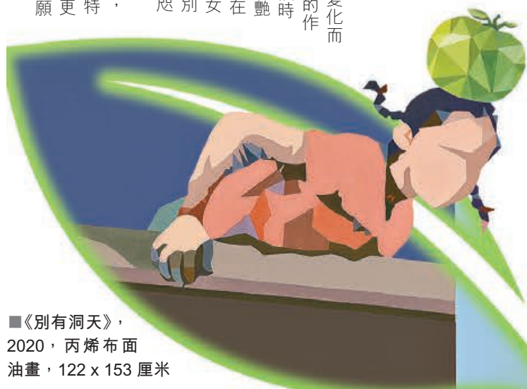
■《別有洞天》，2020，丙烯布面油畫，122 x 153 厘米

“我希望自己的作品都是由心而發，將帶給我感觸的點滴轉化為藝術語言，而不是跟隨市場流行的藝術潮流，這樣才能將我的所見所感表達得更深刻。”