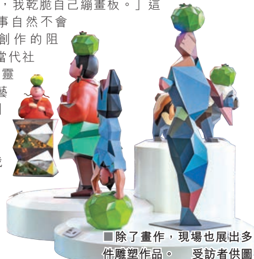
■除了畫作，現場也展出多件雕塑作品。

感，通過細膩入微的觀察力和獨特的藝術語言，創造出充滿生命色彩的系列作品，以敘事性的構圖方式和多樣化的視覺表現手法與觀眾探討對於不同主題的思想認知，「我希望自己的作品都是由心而發，將帶給我感觸的點滴轉化為藝術語言，而不是跟隨市場流行的藝術潮流，這樣才能將我的所見所感表達得更深刻。」