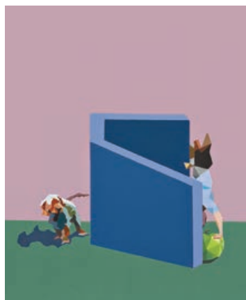
■《隔離》，2020，丙烯布面油畫，122 x 153 厘米