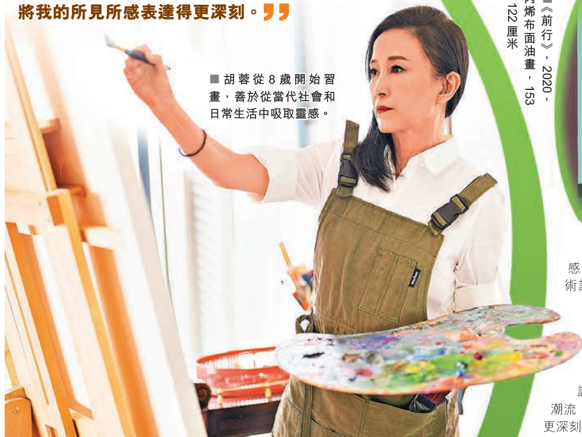
■《前行》，2020，丙烯布面油畫，153 x 122 厘米