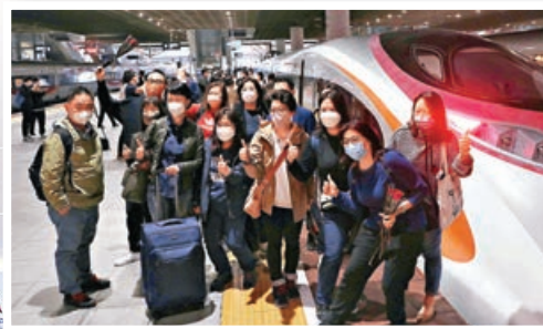
港人在北上的高鐵車廂內，興奮地合照。