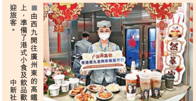
由西九開往廣州東的高鐵車上，準備了港式小食及飲品歡迎旅客。

高鐵香港段復運後，同時增設了廣州東站。1988年開始投入服務的廣州東站位於商業中心天河區，臨近廣州塔、珠江新城等地標，站內可直接換乘地鐵，以及連