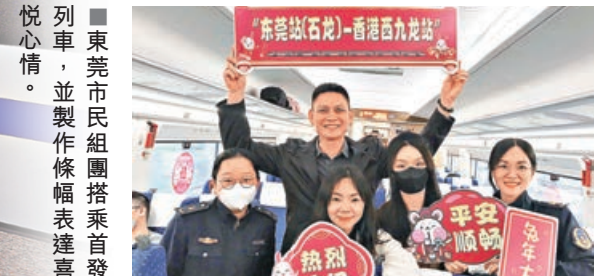
東莞市民組團搭乘首發列車，並製作條幅表達喜悅心情。