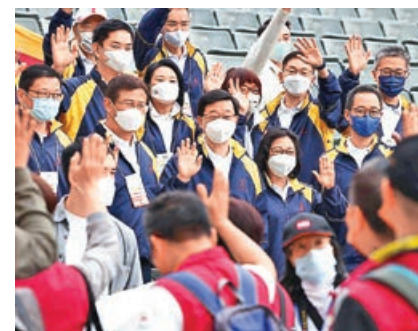
■李家超與夫人李林麗嬋昨一同出席活動。

另外，李家超夫人李林麗嬋是香港公益金會長。港島、九龍區百萬行前年起因受到疫情影響而移師線上舉行，去年11月於新啟用的將軍澳跨灣連接路恢復舉辦實體新界區百萬行，今年則回到港島、九龍區。今次百萬行全程約10公里，途經黃泥涌峽道、布力經及香港仔水塘道，終點為香港仔郊野公園遊客中心。