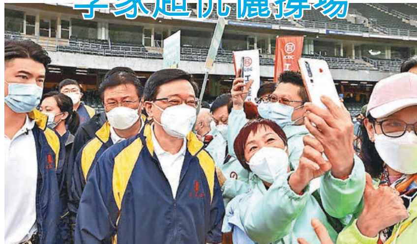
■參加百萬行的市民興奮地拿出手機與李家超合影留念。

行政長官李家超與夫人李林麗嬋昨一同出席公益金港島、九龍區百萬行開步禮，為參加的隊伍打氣，眾多健兒熱情與李家超拍照留念，場面熱鬧。今次百萬行是公益金2023年首個大型籌款活動，有超過8千人參與，籌得的善款將會全數資助24間提供「家庭及兒童福利服務」的會員機構，協助有需要家庭以及鼓勵成員之間建立互愛互勉的緊密關係，並針對家庭的需要提供輔助服務。