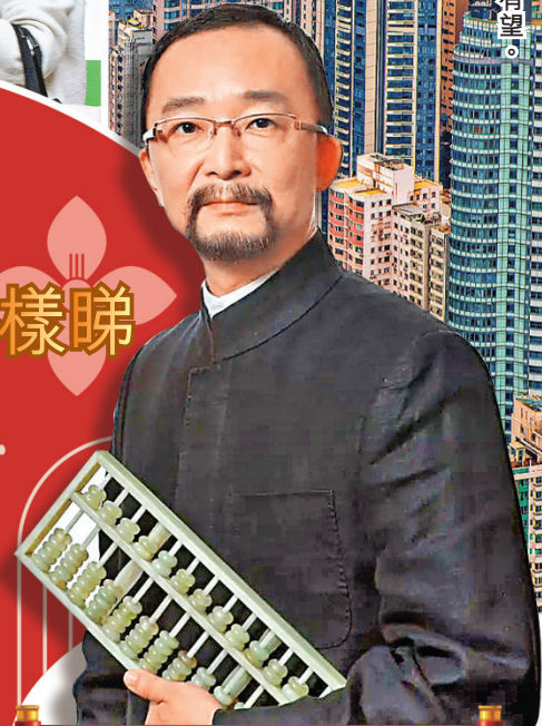
鐵板神數 侯天同師傅