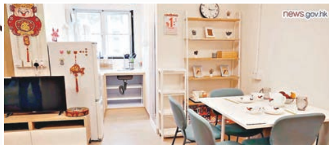
■面積300多平方呎的簡約公屋單位，五臟俱全。

特區政府計劃5年內興建3萬個「簡約公屋」單位，房屋局將於下月8日向立法會工務小組申請撥款，相關細節亦陸續曝光。政府將啟德社區隔離設施改裝成「簡約公屋」示範單位，並於昨日首度公開「簡約公屋」示範單位的實景片段。本報記者從片段所見，示範單位面積約300多平方呎，適合4至5人家庭入住，單位間隔與政府早前發放的模擬圖相若，有獨立廚廁，但採取開放式廚房設計，類近市面大部分過渡性房屋的設計。