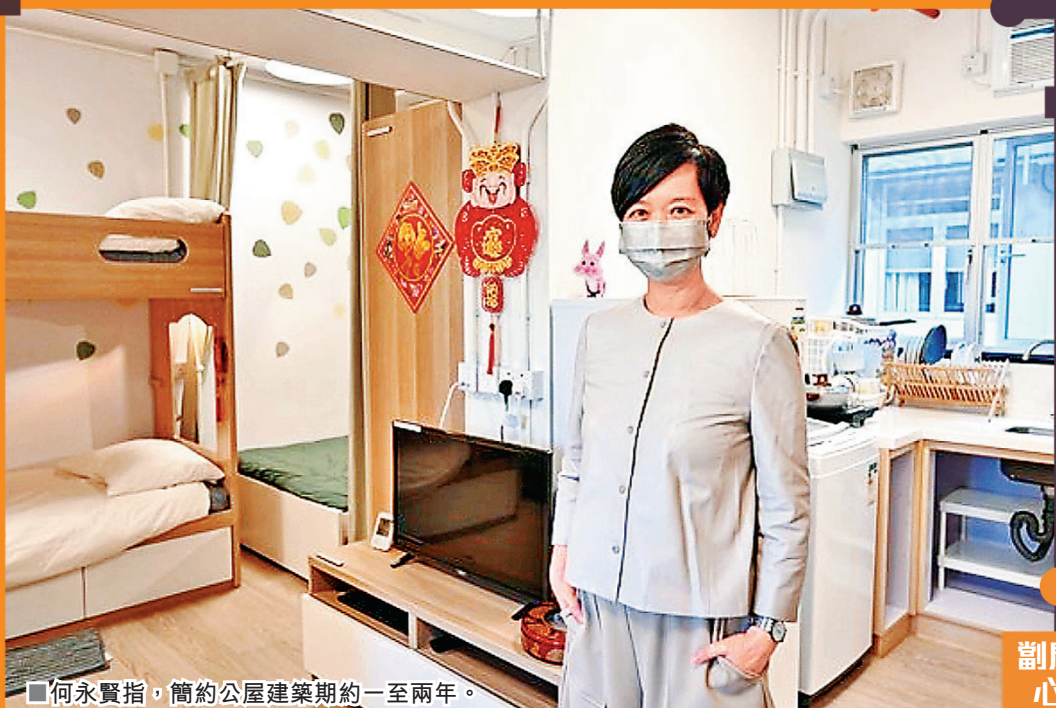
■何永賢指，簡約公屋建築期約一至兩年。