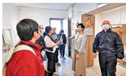
■何永賢(右二)帶同劏房戶到簡約公屋示範單位參觀。

據了解，位於市區的啟德世運道地皮佔地約5.7公頃，是新選址中最大一幅，鄰近啟德港鐵站，可供應約10,700個單位；柴灣常安街用地最小，旁邊是柴灣THEi，佔地只有0.9公頃，預計興建約1,600個單位；牛池灣彩興道約1.1公頃地則可興建約2,300個單位。位於屯門小欖樂安排前海水化淡廠用地，佔地約3.8公頃，可建約5,000個單位。