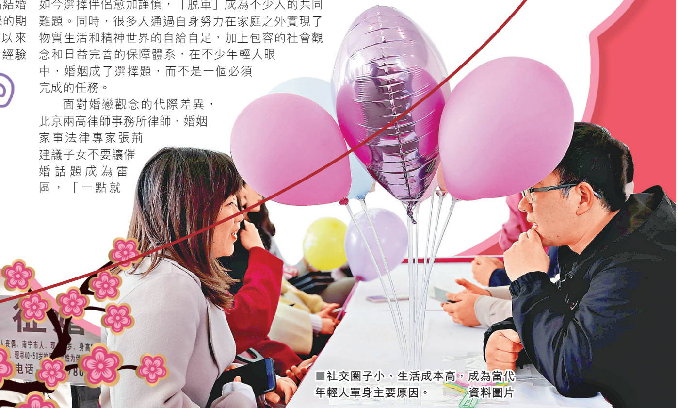
■ 社交圈子小、生活成本高，成為當代年輕人單身主要原因。 資料圖片