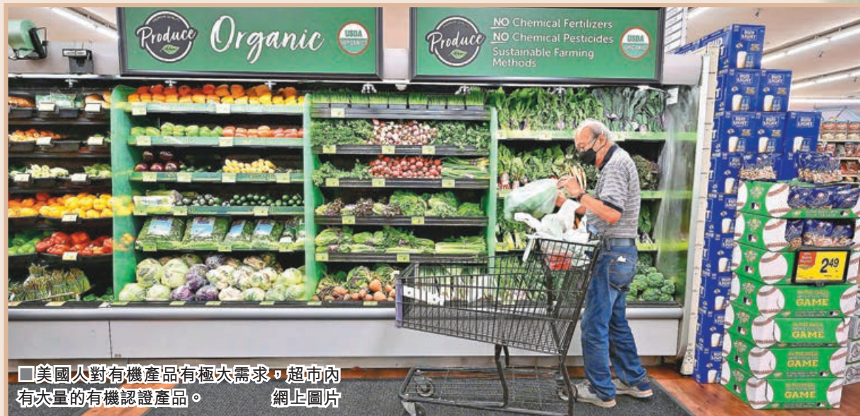
美國人對有機產品有極大需求，超市內有大量的有機認證產品。