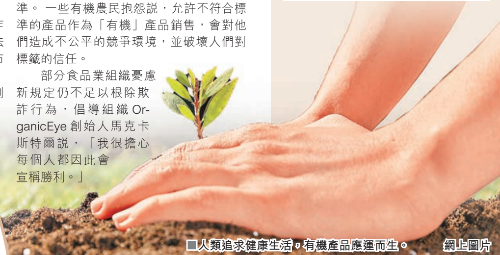
人類追求健康生活，有機產品應運而生。

通過認證的美國有機農場數量也持續增加，截至2021年共有1.7萬個，較2008年增加約3,000個，總種植面積達490萬英畝。