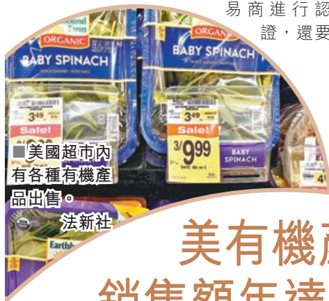
美國超市內有各種有機產品出售。